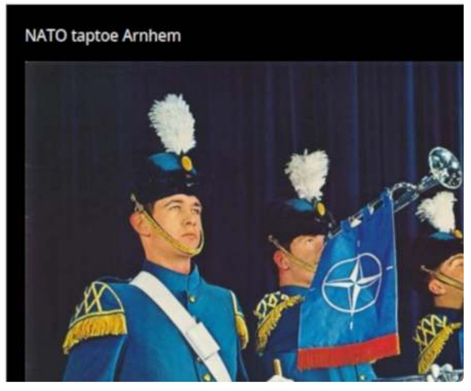
Een evenement in de stad op de datum waarop de vriend van de auteur van de weg reed.

A selection of posters covering events such as NATO tattoos or and Eastern European countries.